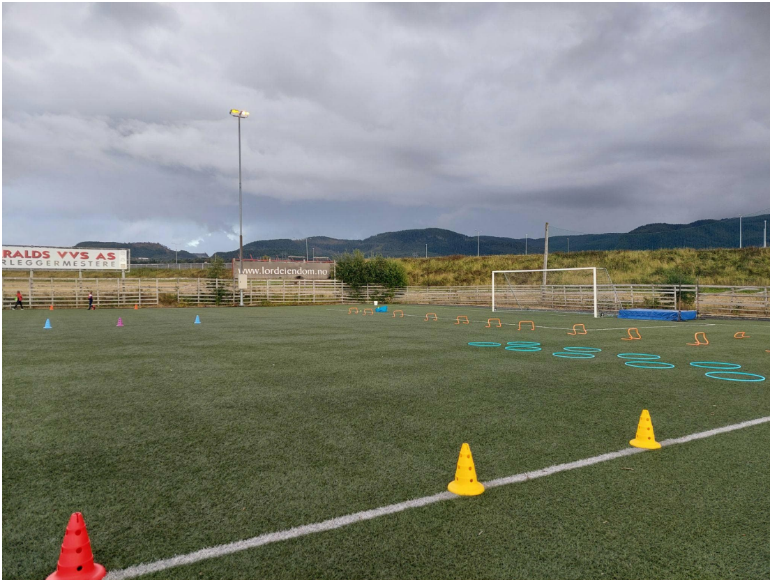
Bilde fra friidrettstrening med allidrett på Klett kunstgress.