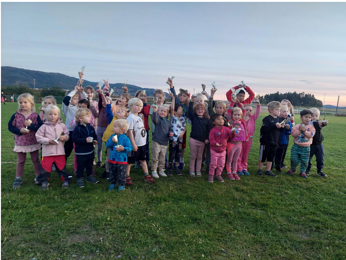
Bilde fra premieutdeling for klubbmesterskap i friidrett.