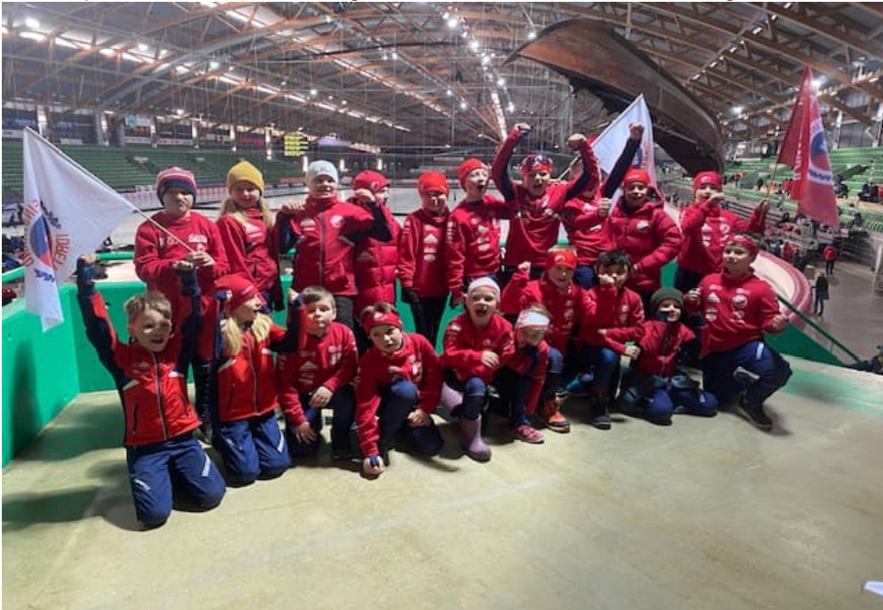
De yngste som deltok på Sandefjordløpet

klubben i antall deltagere . Det ble rekordras på personlige rekorder og alle gikk rundt med et stort smil. Utrolig artig å være trener på et slikt stevne og se den skøytegledden alle løperne har. På lørdag kveld var det felles middag for Leinstrand-gjengen